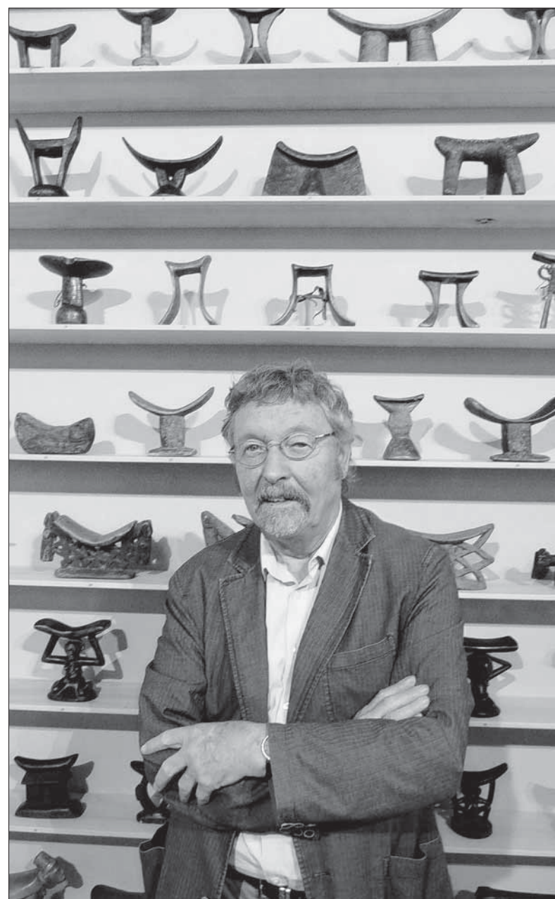
An Hieroglyphen erinnern Kopfstützen aus Afrika, die der Sammler Klaus Horn zu einer Installation zusammengestellt hat.

i „Glanzlichter der Sammlung Horn“: bis 22. November im Kornhaus Bad Waldsee. Geöffnet nur Fr. 14.30 bis 17 Uhr und So. 13.30 bis 17.30 Uhr. Führungen auf Anfrage. Tel.: 07524 / 48 228 oder 7933.